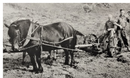
Asbjørn og sønen var i slåttan med tospent slåmaskin etter 1958.