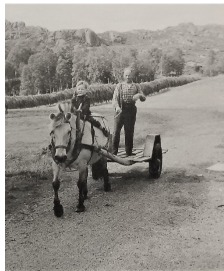
Sven Solberg og sønesonen Svein heim med hest og langkjerre.